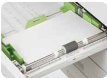
Rullo di separazione