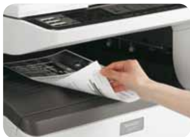
Stampa e copia in fronte-retro