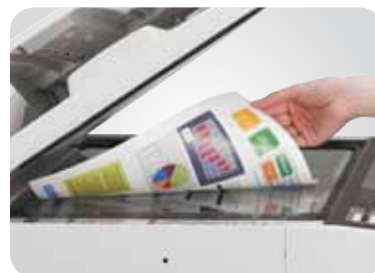
Scanner a colori